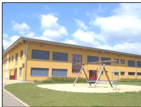
Serbska zakładna šula Rabicy