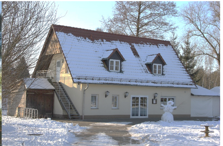
towarstwowy dom Nowoslicy 2017