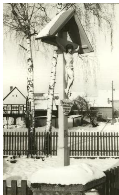
1991 – křiž před Lipičec dworom