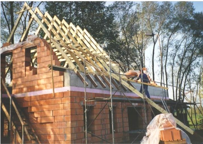
towarstwowy dom Nowoslicy 1995