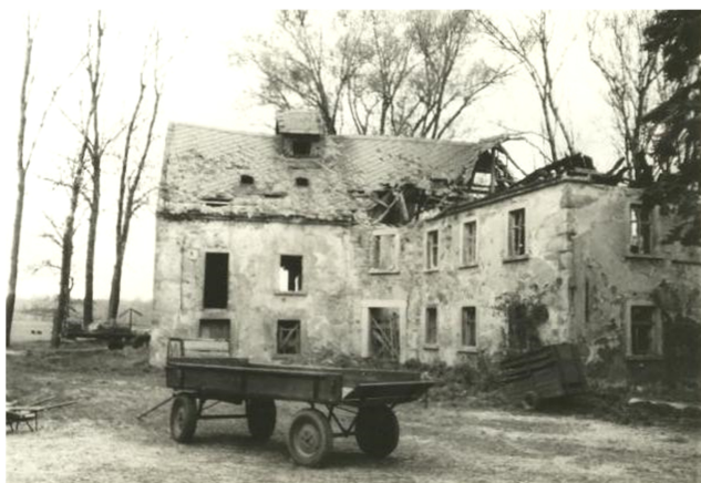
Jurasowy młyn Nowoslicy

Jurij Cyž: 1848-1874, syn Pětra Cyža, 1863-1869 gymnazijst w Praze, aktiwny člon Serbowki, wot 1864 člon Maćicy Serbskeje, 1869-1873 studij teologije w Praze a w Münsteru, spisowaćel