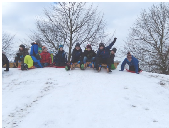
Při sankowanju knježeše na horje hołk a tołk.