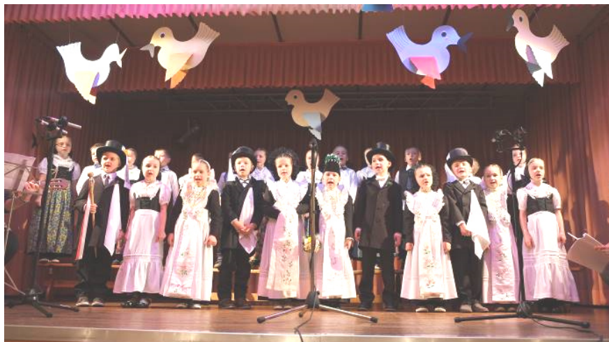
fota: knjeni Mittagowa