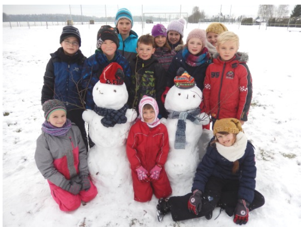
Šulerjo 3. lětnika natwarichu rjanej sněhowej mužej.

Šulerjo 1. lětnika nawuknychu w hudźbje spěw "Sanje, sanje sydń so na nje". A w sportowej hodžinje to potom zwoprawdźichu. Tež wšitke tamne lětniki našeje zakładneje šule mějachu swoje zymske wjesela, wšako je sportowanje w sněze wobstatk wučbneho plana.